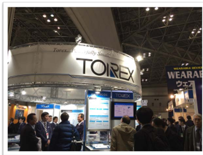
「第1回ウェアラブルEXPO」